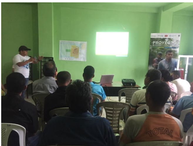
Representantes de la comunidad, guardaparques y autoridades durante taller efectuado en la Reserva Marina Galera San Francisco en el sur de Esmeraldas.