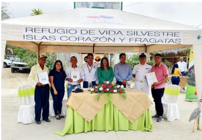
Autoridades y representantes de organizaciones pesqueras durante la entrega de nuevos Acuerdos de Uso Sostenible y Custodia de Manglar (AUSCM) en el Refugio de Vida Silvestre Isla Corazón y Fragatas en la provincia de Manabí.