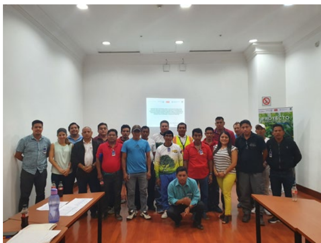
Equipo técnico del Proyecto Marino Costero y la Subsecretaría de Gestión Marina y Costera en la socialización de los planes de manejo para organizaciones pesqueras de la provincia del Guayas, que desean acceder a Acuerdos de Uso Sostenible y Custodia de Manglar.

📍 29,34 hectáreas de manglar en nuevo AUSCM