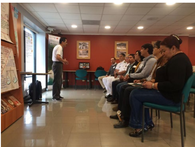
Taller de Manejo Costero Integrado desarrollado en la ciudad de Portoviejo junto a autoridades y funcionarios.