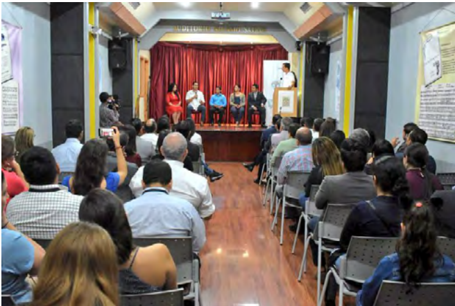
Panelistas invitados durante el lanzamiento del documental Con las raíces en el Manglar organizado por la Subsecretaría de Gestión Marina y Costera y el Proyecto Marino Costero.