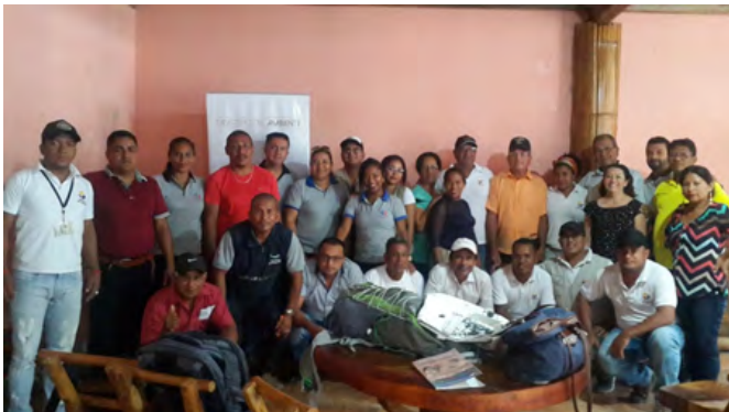
Representantes de la comunidad, guardaparques y autoridades durante taller efectuado en la Reserva Marina Galera-San Francisco.